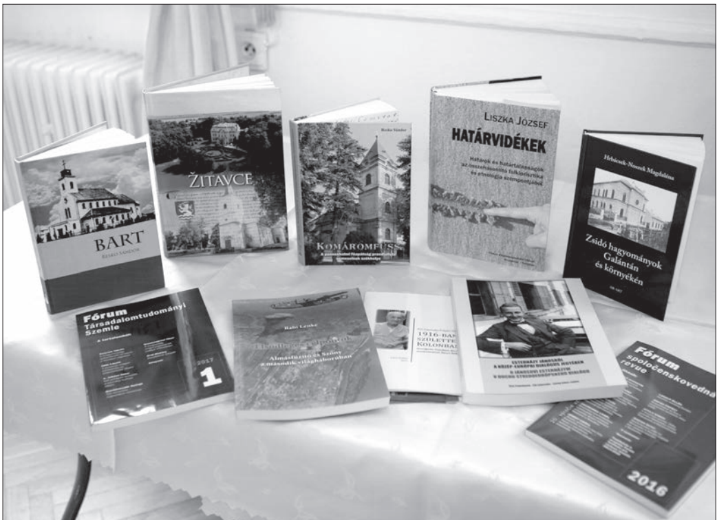
Az ismertett könyvetermés 2017-ben