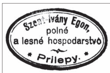
Pečiatka lesného panstva rodiny.